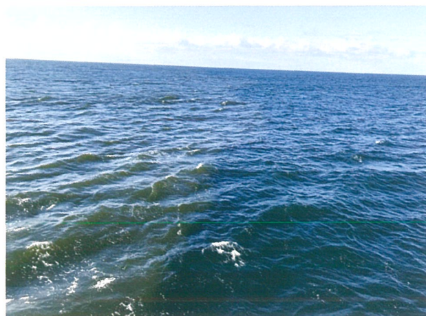
図3 赤潮発生時の海水